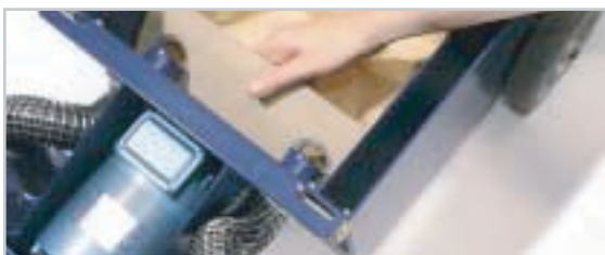
Leichter Wechsel des Staubbeutel.