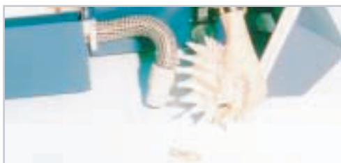
Bürstenset für aggressive Tiefenreinigung oder Nylon für Routine Reinigung

Regelmäßige, meist monatliche Unterhaltsreinigungen der Fahrtreppen und Steigen tragen nicht nur zur Schonung der Mechanik bei und somit zur Senkung der Wartungs-kosten sondern auch zum wesentlich verbesserten optischen Gesamteindruck.